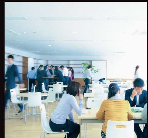
働く仲間が集い、共感を深める コミュニケーション空間 「カフェバレ」