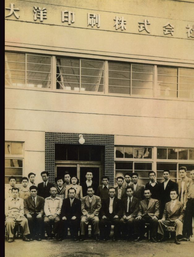
長年培った経験と品質へのこだわりの原点 — 戦後間もない頃の大洋印刷

ホールディングス体制のもと、それぞれの専門性を活かした5社が連携し、 課題に応じた最適なチーム編成とスピーディな対応を実現しています。