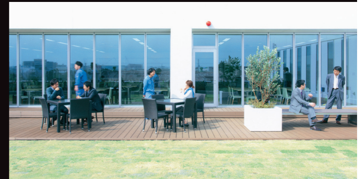
見晴らしの良い、社員のコミュニケーションの場ガーデンスペース