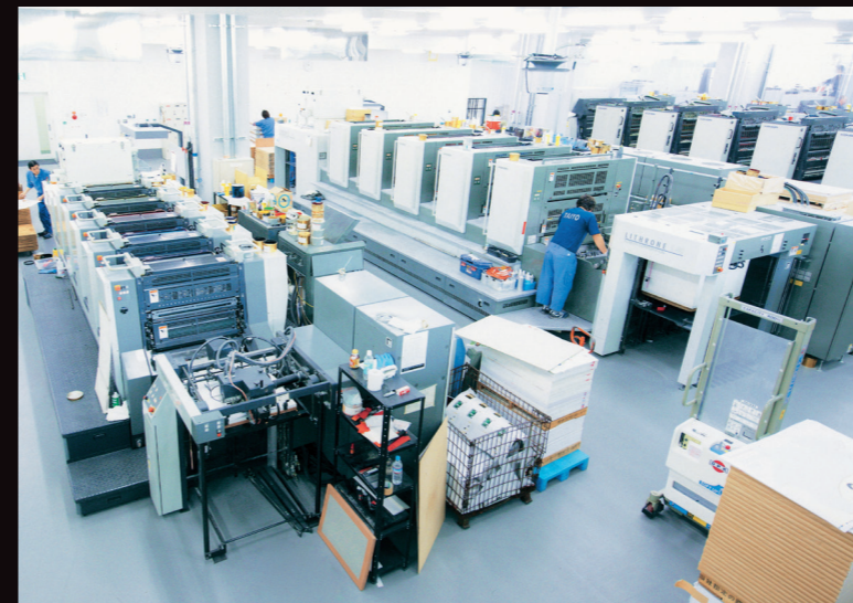
品質を支え続ける 印刷の現場