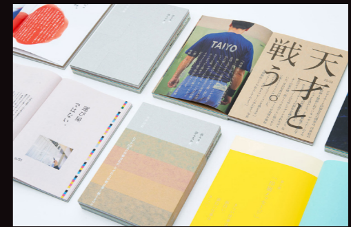
大洋印刷の すべてが詰まった1冊 自社発行の ブランドブック 「消える紙、 消えない紙。」