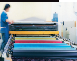
細部へのこだわりを 形にする 校正印刷機